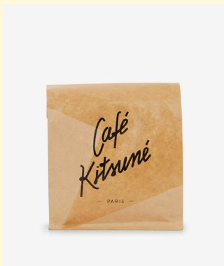
Signature blend 250gr 16 100gr 10