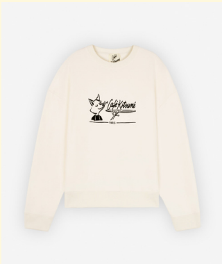
Plate sweatshirt 170 XS/S/M/L/XL

DÉCOUVREZ LA COLLECTION DE PRÊT-À-PORTER & ACCESSOIRES