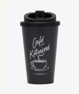
Coffee cup tumbler 50