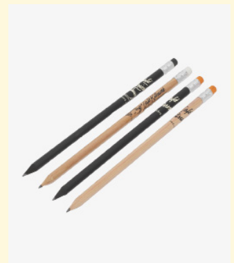
Set of 4 pencils 25