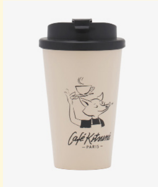
Cup tumbler 50