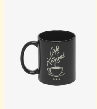
Coffee mug 25