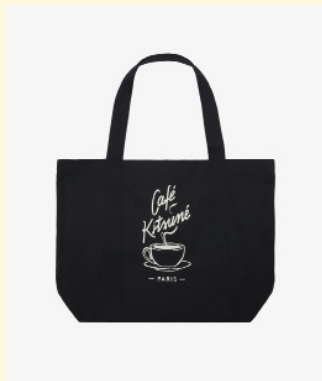
Coffee cup tote bag 70