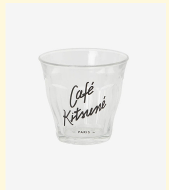
Duralex Picardie 16cl 10 36cl 15