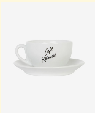
Cup & saucer ceramic Small 20 Medium 25 Large 30