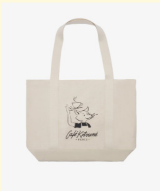
Fox tote bag 70