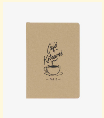
Notebook lines 25