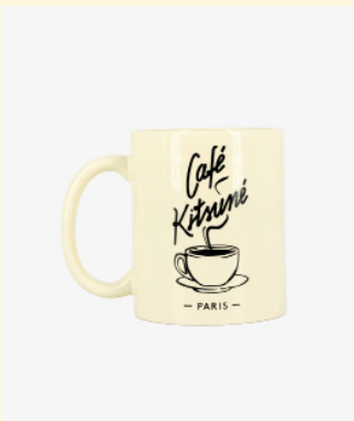
Coffee mug 25