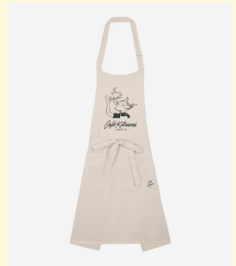
Cup apron 70