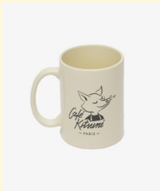
Fox mug 25