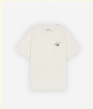
Fox tee-shirt 90 XS/S/M/L/XL