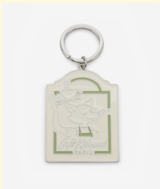
Fox keyring 60