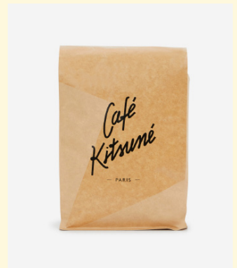
Signature blend 1kg 40